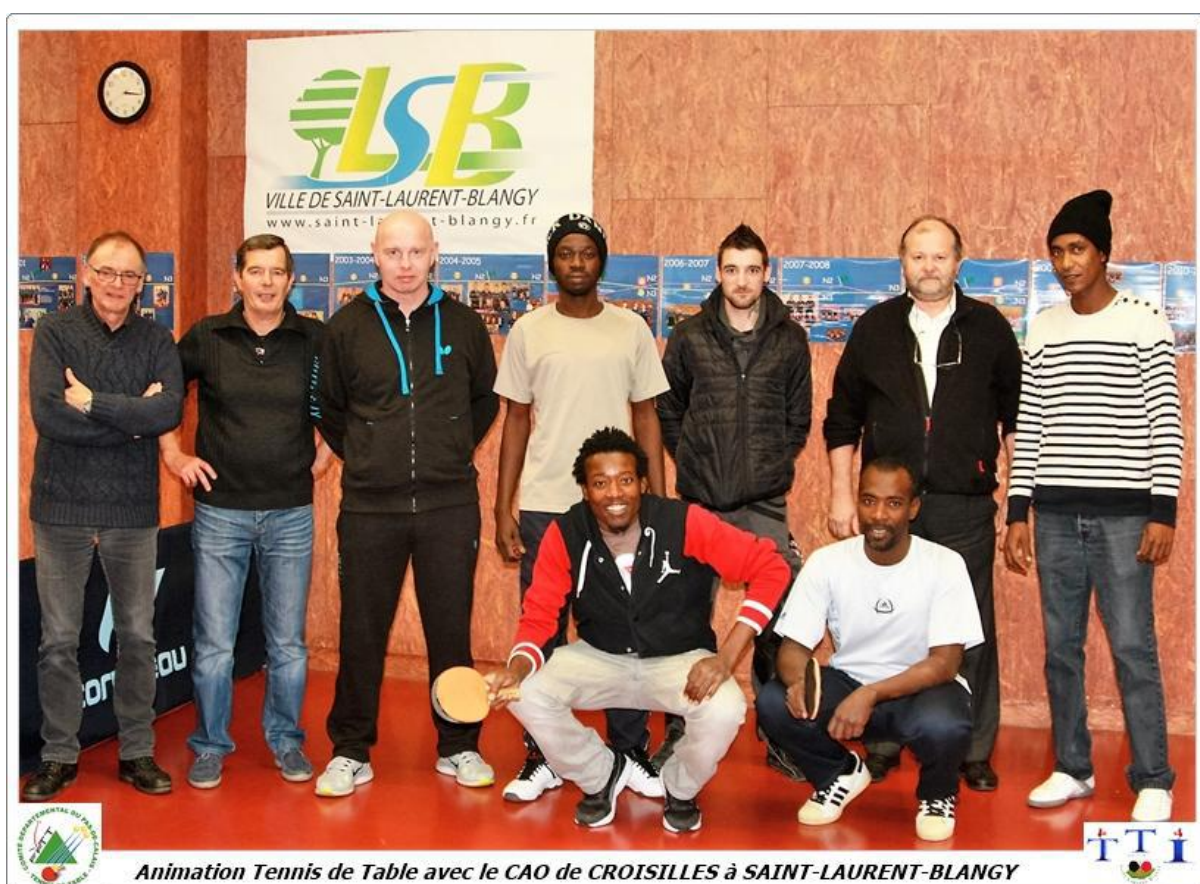
Animation Tennis de Table avec le CAO de CROISILLES à SAINT-LAURENT-BLANGY