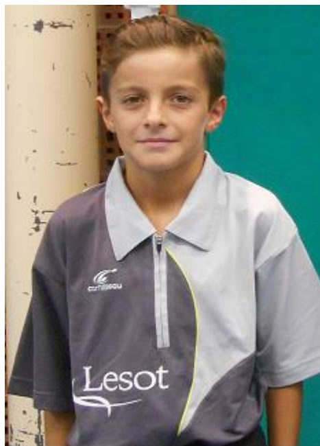
JOUEUR DE L'ANNEE